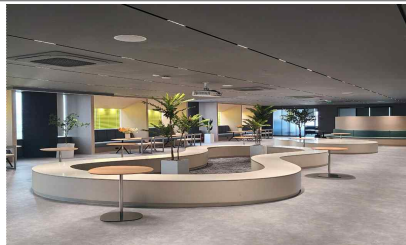
▲ 14F 코워킹스페이스