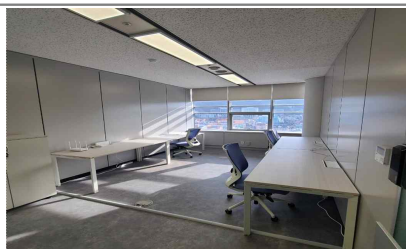
▲ 11F 키움(4인실)