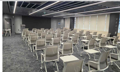
▲ 14F 미디어홀